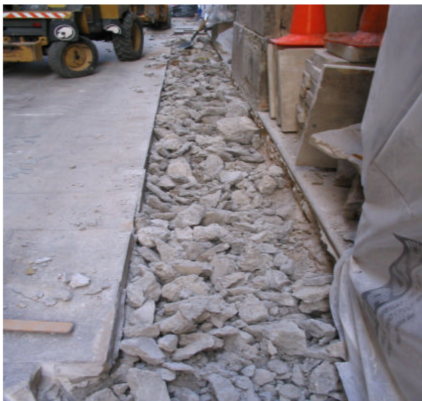
Fotografia núm. 2: Obertura de la rasa 200