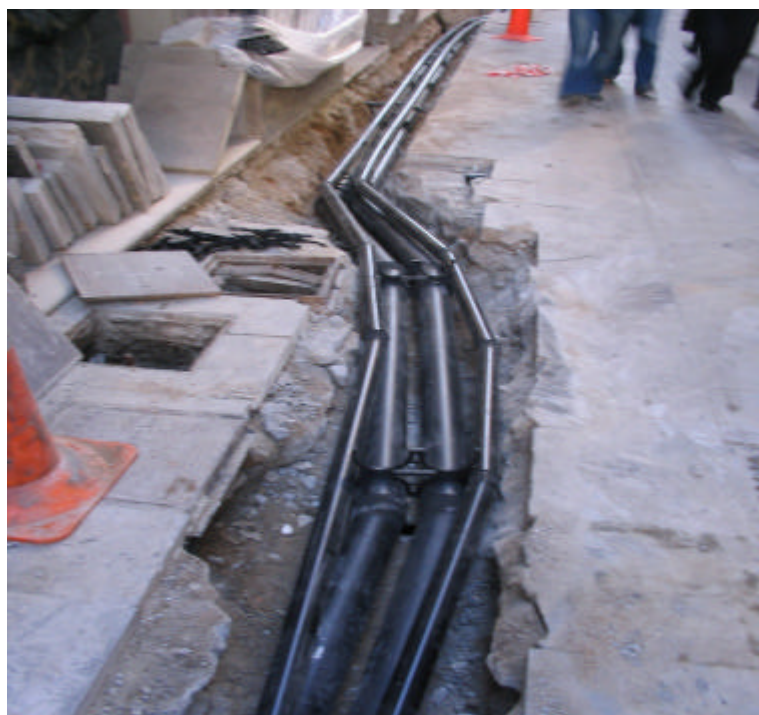
Fotografia núm. 4: rasa 200 un cop oberta