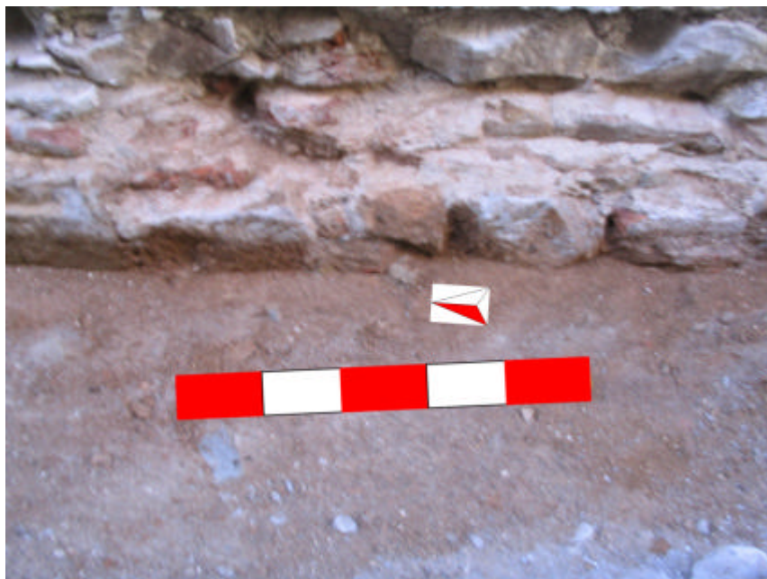
Fotografia núm. 3: UE 204