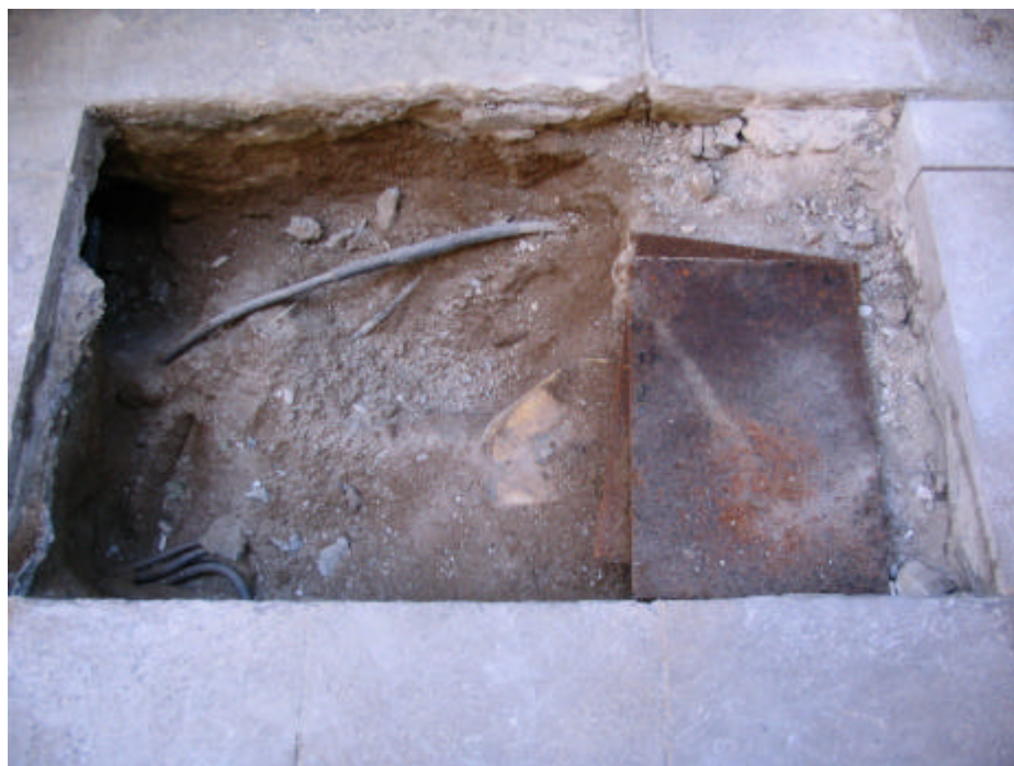
Fotografia núm. 1: Rasa 100 un cop oberta